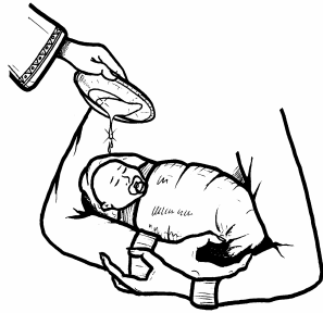
2. PAGPAPA- BAUTISMO