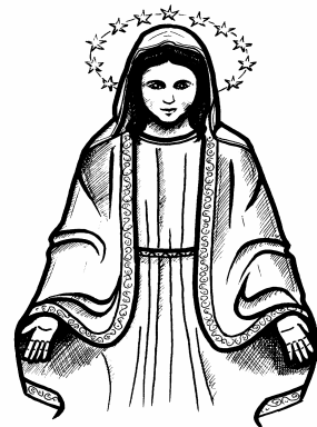
7. PAGDARASAL AT PAGIGING TAPAT KAY MARIA