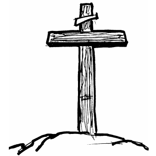
10. PAGTITIWALA KAY JESUS BILANG TAGAPAGLIGTAS